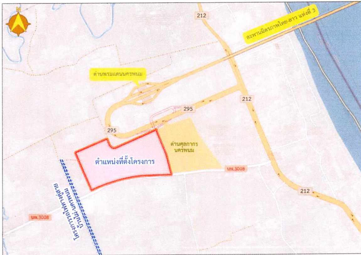
รูปที่ 1 ที่ตั้งโครงการศูนย์การขนส่งชายแดนจังหวัดนครพนม