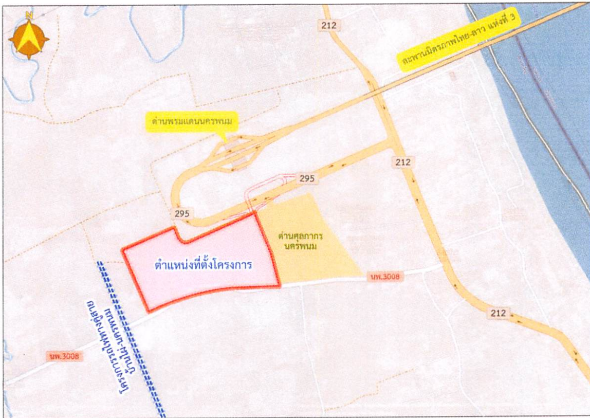
รูปที่ 1 ที่ตั้งโครงการศูนย์การขนส่งชายแดนจังหวัดนครพนม